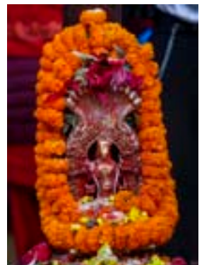
माधव नारायण पेज ४-५

साहित्य - ६ अन्जना ताम्राकार माणिक उपाय पूर्ण मुनंकीर्मी