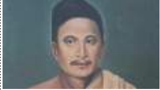
गद्यगुरु पं. निष्ठानन्द बज्राचार्यया ललितविस्तरया प्रभाव शरद कसा: - २