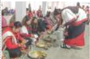
भव्य नयधुंका: गवा: गव्य नकी पन्नारत्न महर्जन - ६