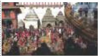
बालिचःहे व थुक्रियालिसे स्वा:गु बाखं - २ नानीकाजी सापू - ३