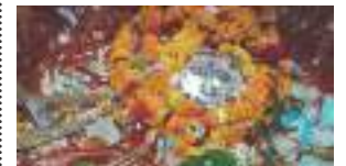
किपा ४ - ५