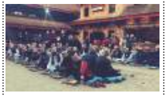
भव्य नकीबलय छाया श्वे हायकी ? पन्नारत्न महर्जन - ३