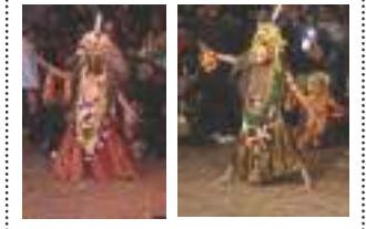
नरसिंह व बराह अवतार ४ - ५