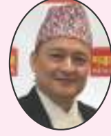
महिन्द्र प्रधान नायः

गजमकुगुओहजग ककमप्ल/sF Newah Organization of America Maryland, U.S.A.