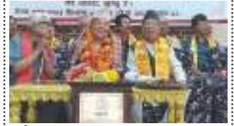
गणेश सायूमि : बीत तत्परम्ह व्यक्तित्व • नानीकाजी सापू - २