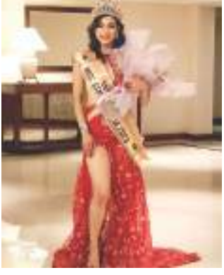
दुबइलय् जूगु अन्तराष्ट्रिय सौन्दर्य कासाय् 'मिस स्टार युनिभर्स

२०२३' या शिर्ष उपाधि सृष्टि महर्जनं त्याक्गु दु।