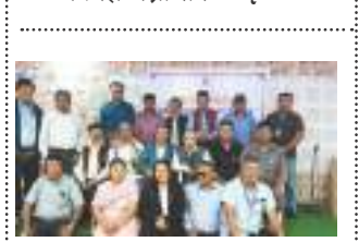
नेपालभाषा आन्दोलनया धिसिलाःगु थां भाजु गणेश सायूमि हना • फोटो फिचर ४ - ५