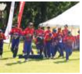
नेपा:यात न्हापांखुसी 'एकदिवसीय' मान्यता प्रज्ञीत शाक्य - ६

खँहाबँह्ला शाक्य सुने, नाय, नेवा: हलिं दबू, नेपा: देय् मू कव: