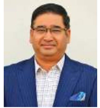
प्रतिनिधिसभाय जिगु भूमिका जुइ ।

३. प्रतिनिधिसभा जि वनधा:सा विशेषयाना: संघीय लोकतान्त्रिक गणतान्त्रिक नेपा:या संविधान घोषणा यायधुंकेगु दु, उगु संविधानयात व्यवहारय कार्यान्वयन यायगु नितिं जिगु मू भूमिका दइ । अभ नं यक्व ऐन कानून दयकेमानी । जनपक्षीय ऐन कानून दयकेगु नितिं, अथेहे प्रदेश, स्थानीय तहलिसें लोकतन्त्र बल्लाके गु नितिं व जनताय स्थापित यायगु नितिं