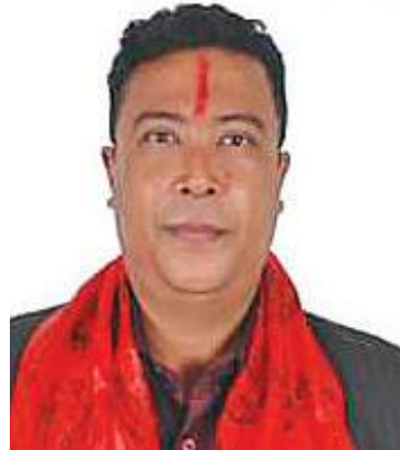
दयकेगु नितिं जिगु उम्मेदवारी खः ।

गल्लि गल्लिइ एम्बुलेन्स दुहांवनेगु स्थिति मडु, लँया सुधार यायमा:गु दु । लँ सुधार यायगु नामय लँ तब्बा: यायगु मखु, उकियात व्यवस्थित याना यंकेगु योजना दु । अथेहे राज्यसत्ताय नेवा:तयगु नं पहुँच