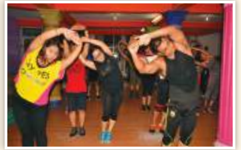
आइतबार देखि शुरुबारसठम विहान ६ बजेदेखि बेलुका ८ बजेसठम शनिबार विहान ६-९ बजेसठम