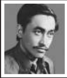
अकल मान महर्जन

बा: ! केवल शब्दया अर्थ जक मखु, वं भीत जीवनया अर्थ थुइकी वं भीत जीवनयू न्ह्यायू स्यनी वं भीत स्वाभिमान स्यनी वं भीत बांला:गु पला:ख्वायू क्यनी भी वहे पलाख्वायू स्वस्वं जीवन न्ह्याकाच्वने जीवनया हरेक पला: पलाखयू वयात भीसं लुइकाच्वने भीसं खंकाच्वने 'बा: !