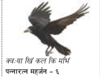
क्वःया खिं कल कि मधिं पन्नारत्न महर्जन - ६