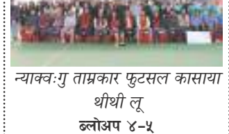
न्याक्वःगु ताम्रकार फुटसल कासाया थीथी लू ब्लोअप ४-५