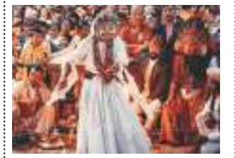
थेचव्यु १२ दै लिपा पिकात श्वेतभैरव प्रशान्त माली - ३