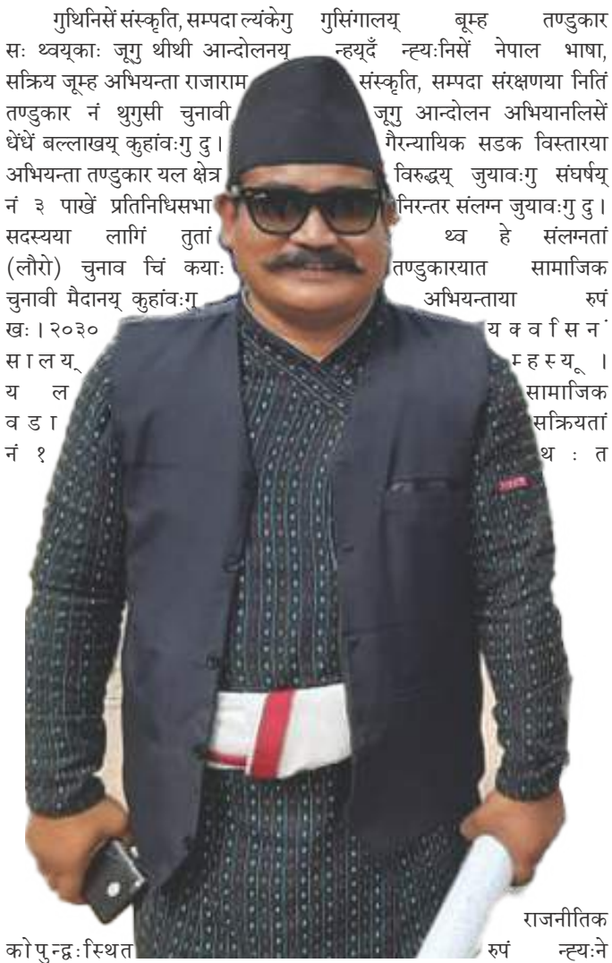
को पुन्द्रः स्थित

चुनावी एजेण्डाया मुख्य बुँदागत शीर्षकय् भ्रष्टाचार न्यूनीकरण, सुशासन अले जनमुखी संसद, भाषा, संस्कृति व सम्पदाया समृद्धि, स्थानीय सरोकारया सहजीकरण, ल्याय्म्ह खेलकूद व रोजगारी अले उद्यमशीलता, सिमान्तकृत पुचःया अधिकार व सामाजिक न्याय, जनमैत्री सन्तुलित विकास व वातावरण संरक्षण, कृषिया विकास व राष्ट्रिय सुरक्षाया विषय दु ।