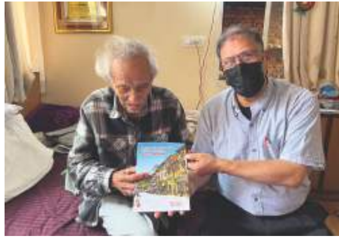
च्वमिया सफू बन्दिपुरया नेपालभाषा वाङ्मय शताब्दीपुरुष डा. सत्यमोहन जोशीयात लःल्हासें।

वयां लिपा लोक साहित्य परिषदया भवनया अंगलय् निर्माणाधीन चक्रसम्बरया पौभाः किपा