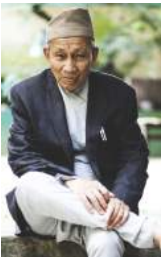
वाङ्मय शताब्दीपुरुष डा. सत्यमोहन जोशी

मृत्यु शास्वत सत्य खः। मनुतयूत न्ह्याक्व हे मययूमा, जन्म जूपिं हरेकया छन्दु मृत्यु जु हे जुइ। बाङ्मय शताब्दी पुरुष सत्यमोहन जोशी, वय्कः अफ् म्वायूमा, वय्कःयाके दुगु ज्ञान भीसं अफ् फया कयाचवने खनेमा धइगु ला सकसिगु मनय् दुगु खः। सकसिनं वसपोलया भिं उसाँय्या कामना नं याःगु खः। न्हापा न्हापा म्हं मफयाः अस्पताल वनाः गुकथं थःगु छैय् लिहांभाल, अथे हे थुगु पालय् नं धिसिमिसि धाय्काः लिहा. भायूमा धइगु सकसिनं मन्तुगु खः। तर, अन्ततः वय्कःया देहावसान जुगु दु। किस्ट अस्पतालय् वासः याकेगु इवल्य् वंगु आइतबाः वय्कः मन्त। आइतबाः सुथसिया ७:०९ ताः इलय् वय्कलं थुगु संसार त्याग यानादिल। वय्कःया उसाँय् स्यनावबलय् वंगु असोज ७ गते वय्कःयात अस्पताल भर्ना याःगु खः। वय्कःया छातिइ