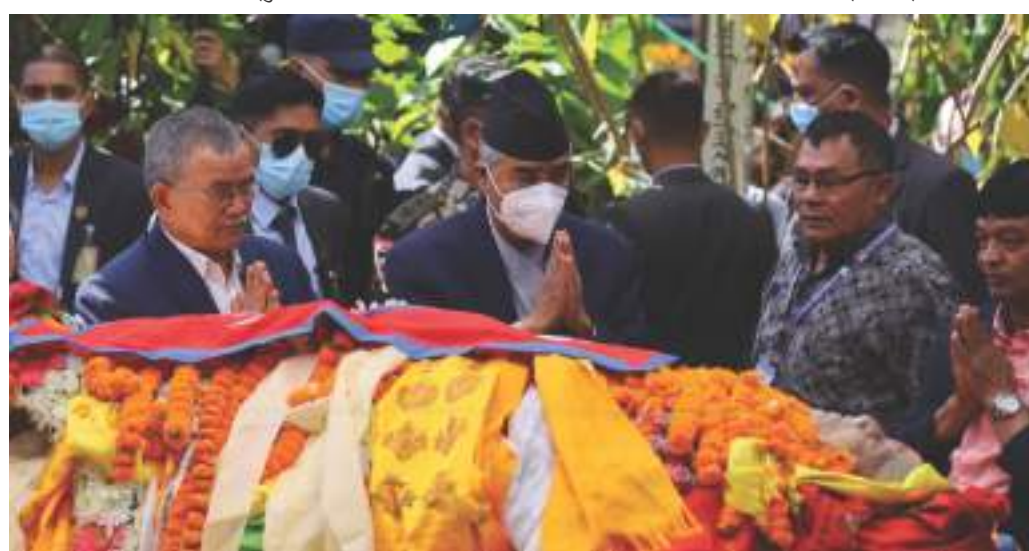
वाङ्मय शताब्दीपुरुष डा. सत्यमोहन जोशीयात अन्तिम श्रद्धाञ्जली देखासें प्रधानमन्त्री शेरबहादुर देउवा।

जातःया खँय् ला छुं खँ मन्त, तर गुकथं छम्ह युगपुरुषयात विदाइ बीगु ज्या जुल, व धाःसा राज्य व स्वंगुलिं तहया सरकारलिसें जोशीलिसें सम्बन्धित सकलसिनं बिचाः यायूमाःगु पक्ष खः। छम्ह शताब्दी पुरुष, युगपुरुषया विदाईया नितिं यायूगु थुलि हे खः ला ? वय्कः छम्ह राष्ट्रिय व्यक्तित्व खःकि यल महानगरपालिका स्तरीय व्यक्तित्व खः ? मेमेपिं गुलिखे मनुत मनुबलय् लिपांगु श्रद्धाञ्जली देखायूत सीम्ह प्रज्ञा भवन प्राङ्गणय् तय्धुकल। न्हापा न्हापा उकथं सीम्ह तःपिं मनुतयूत स्वयंबलय् वय्कःपिनिगु व्यक्तित्वया जाः स्वयां ल्यं ७ पेजय्