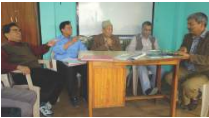
हलिं नेवाः दबूया छू मुँज्याया इवल्य वाङ्मय शताब्दीपुरुष डा. सत्यमोहन जोशीजुलिसे सहलह।

वय्कःया स्मरण शक्ति उगु उमेर्यु नं तिखर तेलाःगु जुयाच्वन। न्ह्यःने वयाच्वंगु हलिं नेवाः दबूया प्यक्वःगु तःमुँज्या अमेरिकाया न्यूयार्क शहरय् जुइत्यंगु बुखँ न्यकाः वय्कःया छुँ सन्देश काय्यु कुतः यायां छुँ ई लिपा