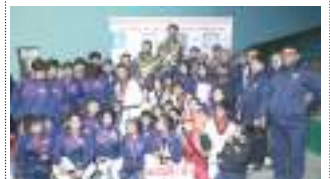
बागमती प्रदेशस्तरीय तेश्रो जुनियर आमन्त्रण मेयर कप तेक्वान्दो प्रतियोगिता २०७९ या लू - ४-५