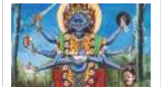
लुँमधि अजिमा भद्रकालीया महिमा प्रेममान डंगोल - ३