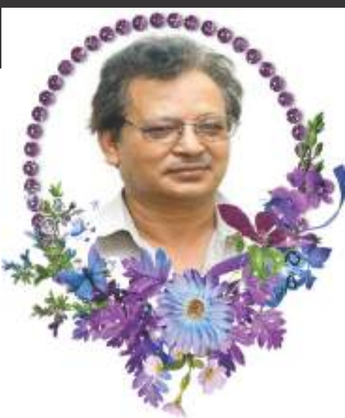
मदुमह पूर्ण वैद्य