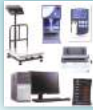
अटोमेटिक मिल्क थ्रान्जिटर सेट नेपाली सफ्टवेयर सहित