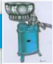
क्रिम सेपरेटर मेसिन