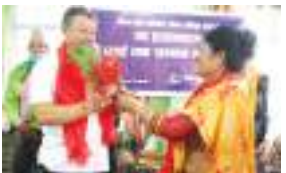
मानव अधिकार संगठन किपू कचापाखे भित्तुता व सम्मान पेज ४-५

संक्रमण नियन्त्रण यायूत धारें स्वनिगलय् थीथी क्षेत्र सील यात