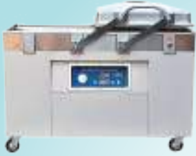
ठ्याकुम प्याकिङ्ग मेसिन

उपलब्ध हुने सामानहरू डेरी, मासु, बेकरी उद्योगकालागि चाहिने उपकरणहरू, प्याकिङ्ग मेसिन, प्याकिङ्ग मेटेरियलहरू, विविध केमिहलहरू तथा विविध औद्योगिक उपकरणहरू ।