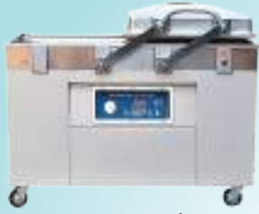
ठ्याकूम प्याकिङ मेसिन

डेरी, मासु, बेकरी उद्योगकालागि चाहिने उपकरणहरू, प्याकिङ मेसिन, प्याकिङ मेटेरियलहरू, विविध केमिहलहरू तथा विविध औद्योगिक उपकरणहरू।