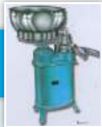
क्रिम सेपरेटर मेसिन