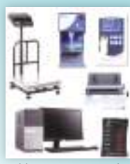
अटोमेटिक मिल्क थ्रालाइजर सेट नेपाली सफ्टवेयर सहित