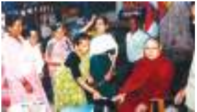
श्रेय्याद बुद्ध शासनया छा:थां भिक्षु ज्ञानपूर्णिक महास्थावरिया लुमन्ति डा. त्रिल मानन्धर "सद्धम्म कौविद" - ५