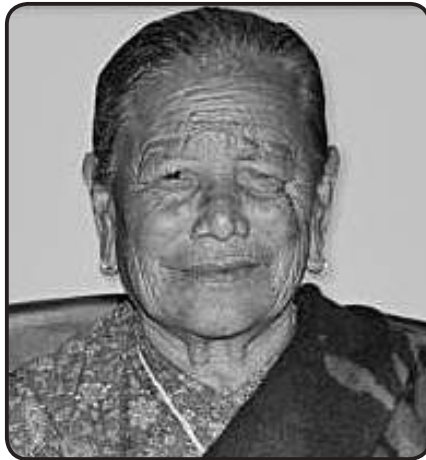
मदुम्ह कयो महर्जन

जिमि छेंया अतिकं हनेवह:म्ह मां कयो महर्जन मद्रूगु दु:खय जिपिं तसकं मर्माहित जुयाच्वनागु दु। थ्वहे सत्ययात थुइका: असार ३१ गते, बुधवा: घसूया पुण्य तिथिस मदुम्हेसिया आत्मायात सदां शान्ति चूलायेमा धैगु कामना यासें थ:थिति, ज:लाखला, पासापिस हपा व तिव: वियादिगुलिं सुभाय् देछाना। मदुम्हेसिया आत्मा सुखावति भुवनस बास लायेमा धका बिचा: हायेका च्वना।