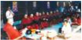
ज्ञान जा:गु ज्ञानपूर्णिक युगया अन्त राजेन मानन्धर - ३