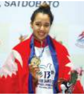
१३ क्व:गु सागया थी थी लू पेज ४-५