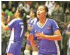
सागय नेपा:या मिसा भलिबलया उत्कृष्ट ब्वज्या प्रजीत शाक्य - ६