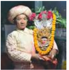
यलया मूलचुक्य थेच्य:या नवदुर्गा प्याखं ४-५ पेज