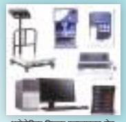
अटोमेटिक मिल्क कान्स्ट्रक्टर सेट नेपाली समरवेयर सहित