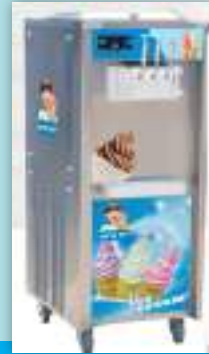
आइसक्रिम मेकिङ मेसिन