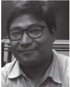
रत्न काजी मन

यँयाःया इलय् जात्रा याइम्ह 'तुयूम्ह किसि' खः । थुकियात पुलुकिसि/तानाकिसि धकाः नं धाय्गु याः । पंया कंलाय् (पुलु) थानाः दय्कीम्ह किसि जूगुलिं थुकियात पुलुकिसि धाःगु खःसा जात्रां गं घाकाः 'ताना ताना' सः वय्क न्ह्याइगु जूगुलिं 'ताना किसि' नं धाय्गु याः ।