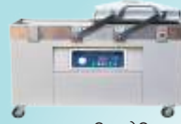
ठ्याकूम प्याकिङ मेसिन

उपलब्ध हुने सामानहरू डेरी, मासु, बेकरी उद्योगकालागि चाहिने उपकरणहरू, प्याकिङ मेसिन, प्याकिङ मेटेरियलहरू, विविध केमिहलहरू तथा विविध औद्योगिक उपकरणहरू।