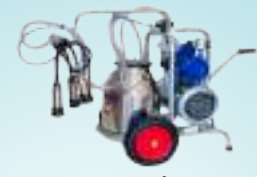
मिल्क सेपर मेसिन