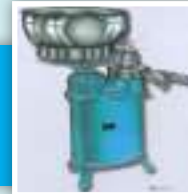
क्रिम सेपरेटर मेसिन