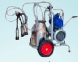
मिल्क सेपरेटर मेसिन