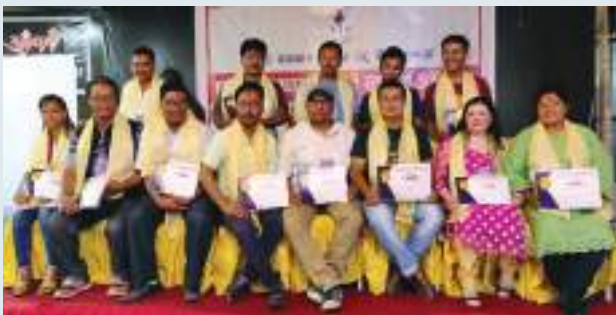
नेवा: पत्रकार राष्ट्रिय दबू येँ जिल्लाया न्ह्यु ज्यासना पुच: