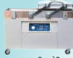
ठ्याकुम प्याकिङ्ग मेसिन

डेरी, मासु, बेकरी उद्योगकालागि चाहिने उपकरणहरू, प्याकिङ्ग मेसिन, प्याकिङ्ग मेटेरियलहरू, विविध केमिहलहरू तथा विविध औद्योगिक उपकरणहरू।