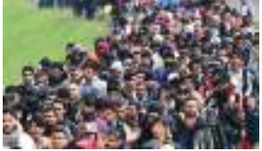
आ: ला वा:चायकेगु ई त्यल डि.आर. खड्गी - २