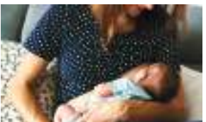
मांयगु दुरु मचायात पोषण पूर्णमा शाक्य -६