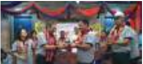
छत्रपाती चिकित्सालय नवनिर्वाचित पदाधिकारीपिनिगु शपथ ग्रहण ज्याइव: