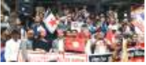
इन्द्रया मेगु पुसा नृपेन्द्रलाल श्रेष्ठ