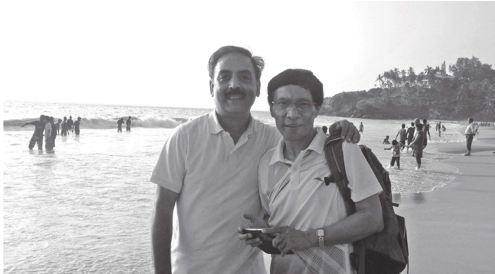
भारत चाःहिलेगु भ्रूलय् केरलाय् निम्ह पुष्कर ।

अभ्यास दूगु नेपाःया पत्रकारिता ख्यलय् सन्याकाःइलय् पिहौवइगु 'महानगर' न्हिपौ पिकाना मेगु न्हूगु अभ्यास वय्कलं न्ह्याकादिल । २०५२ सालय् 'आजको समाचारपत्र' (लिपा नां हिला 'नेपाल समाचारपत्र' जुगु) न्हिपौ पिकानादीम्ह वय्कलं यँया नापनाप विराटनगरं पत्रिका छापेयाना नेपाःदुनै निथासं पत्रिका पिकाःम्ह न्हापांम्ह प्रकाशक जुयादिल धाःसा न्हिपौया विदेशी संस्करण पिकाय्गु भ्रूलय् नं वय्क हे न्ह्यलुवा खः ।