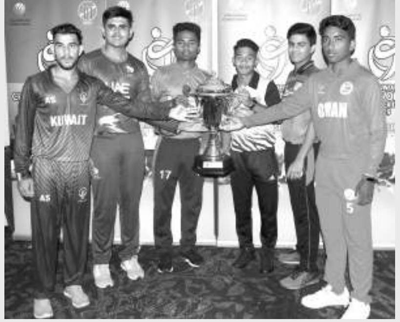
आइसीसी यु-१९ विश्वकप छनोट कासा

नेपालं थःगु स्तर मेमेगु देस स्वयां तसकं च्वय लाःगु धइगु क्यनाबिल । वा वःगुलिं स्वंगु युएइया कासा बाहेक मेगु फुक्क कासाय विपक्षी टिमं नेपाःया न्हयःने याउँक हे पुलिं चूगु खः । तर युएइ विरुद्धया कासाय नेपाःयात भाग्यं साथ मब्यूगुलिं नेपाः तःधंगु हवःताःपाखें बञ्चित जुइमाल ।